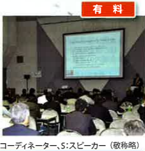
Co:コーディネーター、S:スピーカー (敬称略)